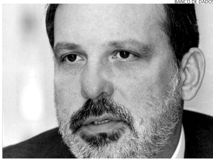
PRESIDENTE DA CNI, Armando Monteiro Neto, quer um Refis 3

Essa suspensão duraria enquanto o parcelamento estivesse em vigência. Segundo o relator Pedro Novais (PMDB-MA), esse artigo rejeitado foi incluído terça-feira a pedido do secretário-executivo do Ministé-