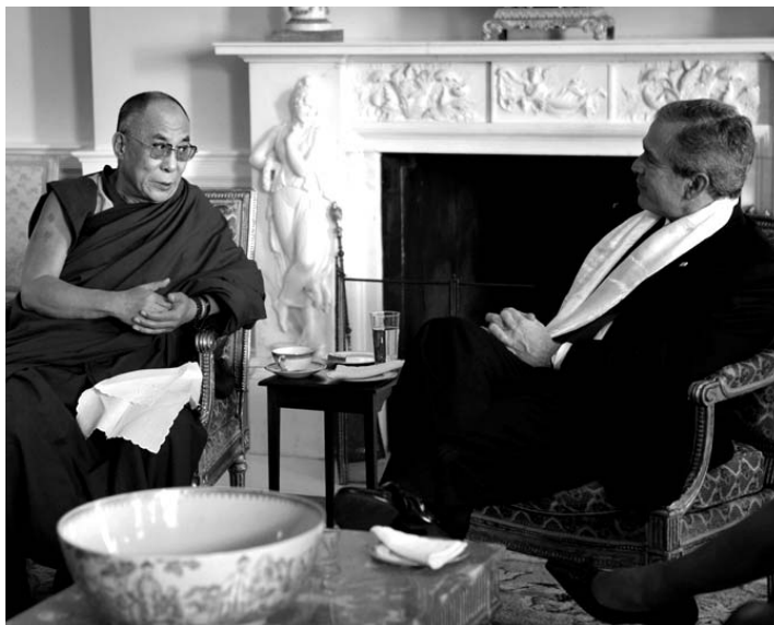
GEORGE W. BUSH (d) recebeu o líder tibetano Dalai Lama (e)

Na véspera, o chefe espiritual dos tibetanos acusou o governo chinês de promover uma política "extremamente repressiva" no Tibet, impon-