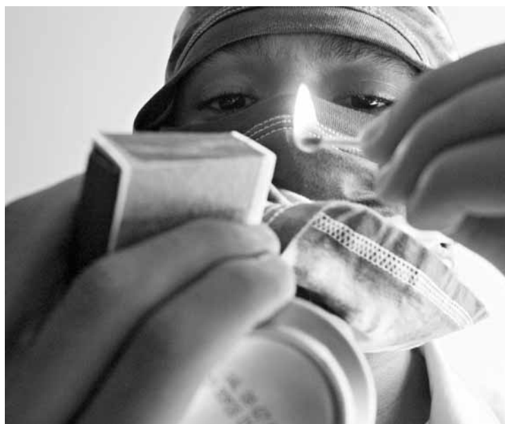
USO DE DROGAS é apontado pelo estudo do Ministério da Justiça como um dos responsáveis pela violência

Contudo, segundo o especialista, este quadro pode ser revertido a partir de medidas radicais, rápidas e enérgicas que devem seguir duas linhas: educação e punição. A criação de escolas de tempo integral, a disponibilidade de atividades ligadas ao esporte, lazer e cultura e castigos mais rígidos aos adultos que obrigam crianças, adolescentes