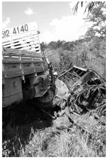
Acidentes nas vias públicas também registraram aumento (21/11/2006)